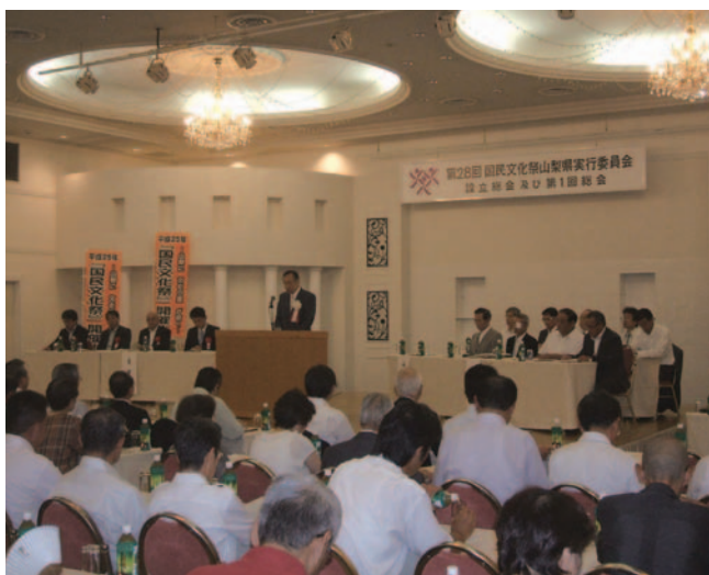
設立総会・第1回実行委員会

なお、これらの詳細内容は、県ホームページ中にある国民文化祭準備室のページに掲載されています。